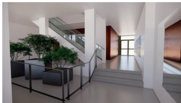
Vue du hall d'entrée