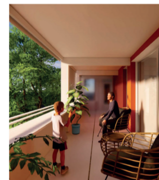
Vue d'un balcon